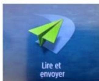
Le scan to mail